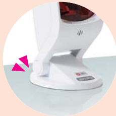
レバー式吸盤標準装備 (Z-6170)