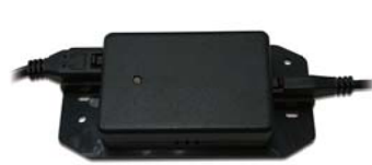
パワーコンバータADP