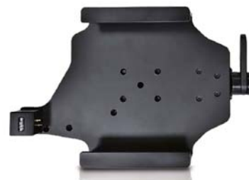
車載用ブラケット