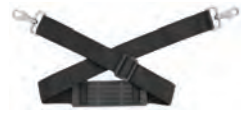
ショルダーストラップ 型式: RTC-SS