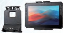
オフィスドッキングステーション 型式:RTC-OD200