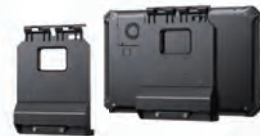
ビークルドッキングステーション 型式:RTC-VD200