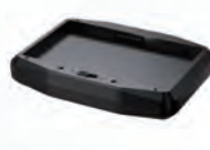
2ベイバッテリー チャージャー 型式:RTC-BC2U