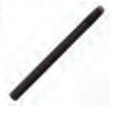
スタイラスペン 型式:RTC-SP