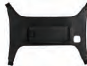
ハンドストラップ 型式: RTC-HS11